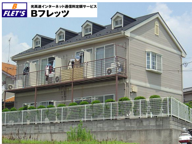
【 外観写真 】