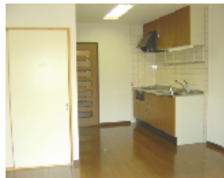
【システムキッチン】